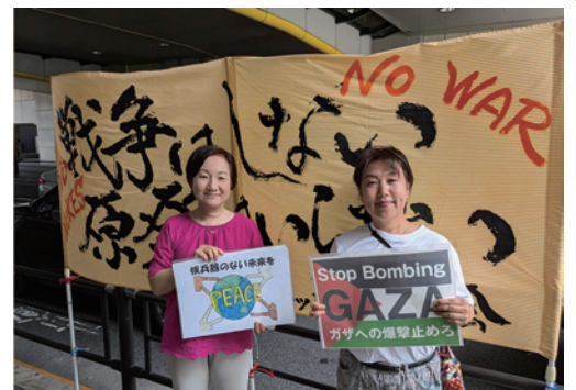
▲「戦争はしない 原発はいらない」の横断幕を掲げて、毎月9日12～13時に練馬駅前でやっている9条スタンディング。ご参加お待ちしております!

一方、日本では「台湾有事」を理由に奄美、沖縄の島々へミサイルや弾薬庫が配備されるなど軍事化が進んでいます。島民からは「島がまた、戦場に