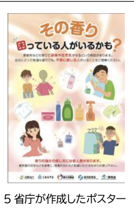
5省庁が作成したポスター

暮らしの中にある洗剤や柔軟剤、消臭剤などの主成分や添加剤の化学物質の有害性や複合影響など、国が調査し規制することが求められています。企業の経済活動優先から国民の健康を守る視点で取り組むよう、引き続き自治体から改善を求めています。